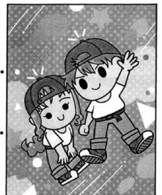
まちがいは5万所 さがしてみまね